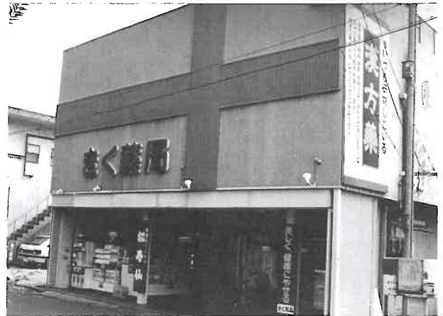
改装後の店舗（昭和 62 年頃）

その代わり、店は漢方や皮フ病相談を中心とした相談薬局としての地盤を固めつつあったので部門を無くした影響はほとんど無かった様です。