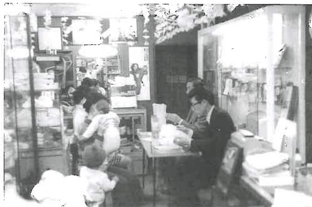
ベビー相談会風景 (昭和 44、5 年頃)

赤ちゃんの育児相談会を毎月 26 日に店内で行い、赤ちゃんを連れて若いママ達が大勢相談に訪れました。その名簿は母が市役所の窓口へ通って教えて頂いたり、また当時は出生した赤ちゃんの情報が新聞に載っていましたので、それを基にDMを郵送させて頂きました。今と違い個人情報の保護など問題にされず、おおらかな時代でした。こうして地域の健康相談薬局としての土台が造られて行きました。