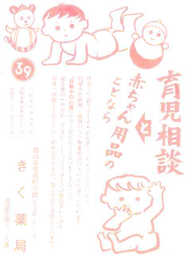
皮フ病相談・ベビー相談のチラシ (昭和 39、40 年頃)