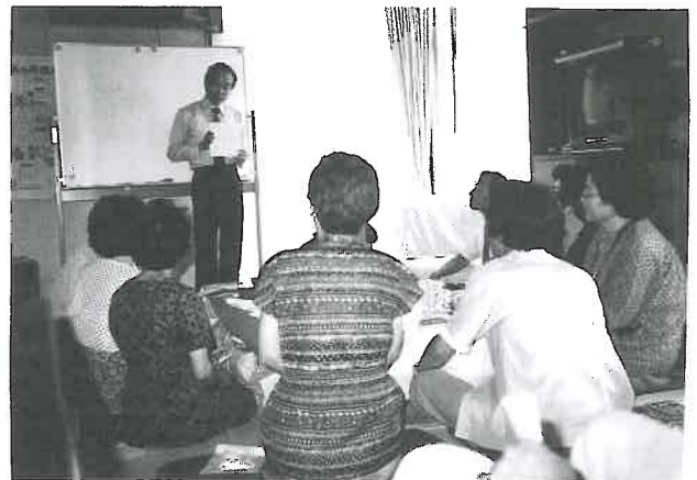
きく薬局健康講演会風景

正しい健康の知識をお伝えし、お客様が御自身や御家族の方の健康を考える機会になればと考えております。