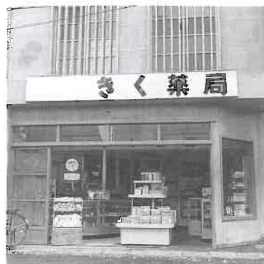
昭和 35 年創業当時の店舗

私の両親は夫婦養子で横田の家に入ったのですが、当時は開店資金に余裕がなく、他の場所に開店する事は考えられなかったため、横田の家が元々あった現在の場所に開店したのだと後に両親から聞きました。